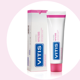
DODATNA POTPORA SA POSEBNIM PROIZVODIMA